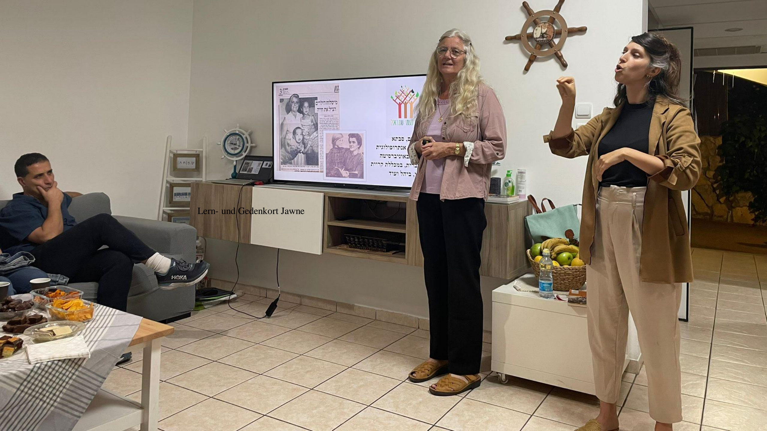
Lern- und Gedenkort Jawne